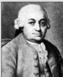
Carl Philipp Emanuel Bach

Quando Haydn si imbatté nelle Sonate per clavicembalo di Carl Philipp Emanuel Bach, il suo commento non riuscì a contenere l'entusiasmo: